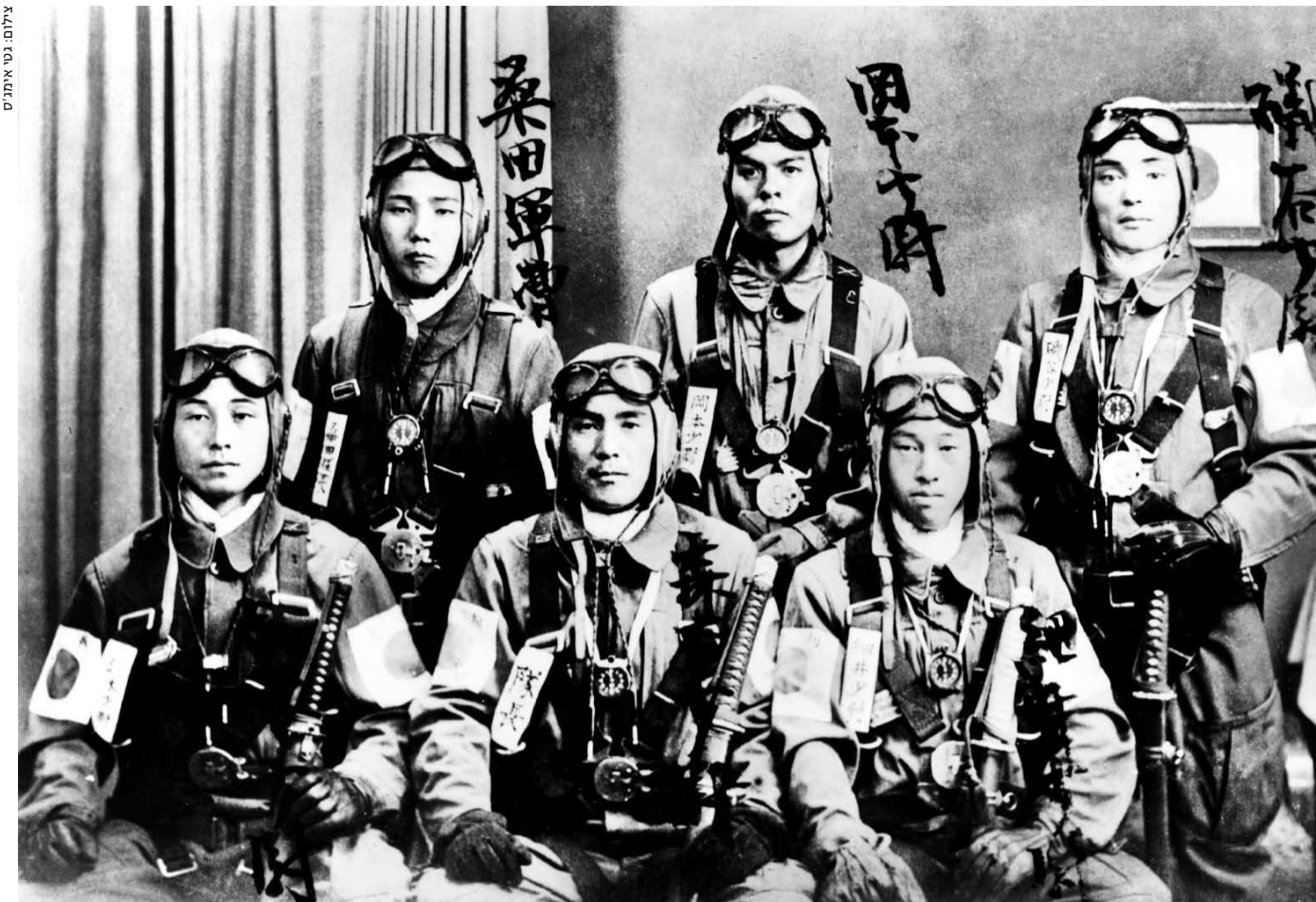
טייסי קמיקזה יפנים. לא כל משימות ההתאבדות הסתיימו בהצלחה